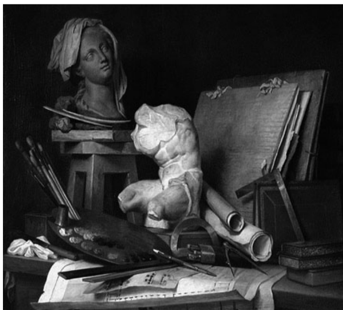
Anne VALLAYER-COSTER, Les attributs des arts , 1769, Musée du Louvre, Paris

L'étude des langues conduit les étudiants à s'exprimer avec aisance et pertinence allemand, anglais ou espagnol comme en français. Elle apporte une ouverture sur les cultures et une connaissance approfondie des littératures et des civilisations des pays germaniques, anglophones ou hispanophones. L'étudiant est aussi confronté aux techniques de linguistiques, de traductions et d'analyses de textes littéraires.